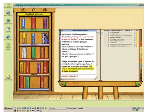
KeeBook Creator Education en mode Lutrin-